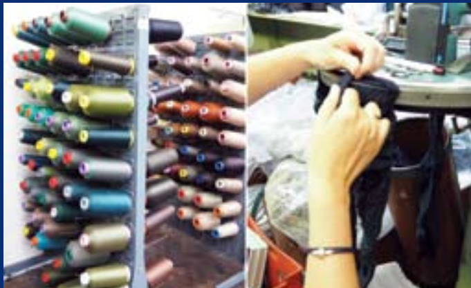
Непостојећа производња чарапа и доњег веша

У 2007. години, закључен је штетан уговор о субвенцији од најмање 116.883 евра за оспособљавање погона нових технологија са предузећем „Фиград компани“ из Врбаса (седиште касније пренето у Нови Сад) за производњу доњег веша и чарапа у Бачкој Паланци. Предузеће није вратило субвенцију, није запослило 20 радника, погон нових технологија не постоји, а фирма је у стечају. Предузеће је добило субвенцију, иако није имало референце за организовање производње овог типа (регистровано је за делатност „неспесијализована трговина на велико“). Фирма у четири пословне године није остварила никакве приходе и нема ниједног запосленог.