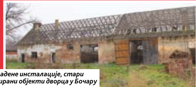
Све је ово плаћено парама грађана: Искидане и покрадене инсталације, стари прозори, неупотребљив грађевински материјал и руинирани објекти дворца у Бочару