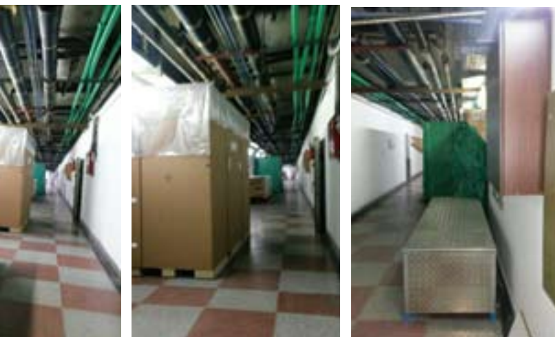
Нераспакована опрема и даље стоји у ходницима

Цена градње и опремања, са првобитних 16 милиона евра, достигла фантастичних 35 милиона евра