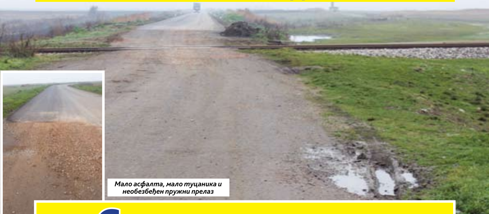
Мало асфалта, мало туцаника и необезбеђен пружни прелаз