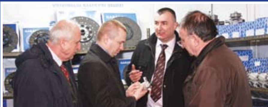
Покрајински премијер Пајтић свечано отвара погон у Оџацима

У 2010. и 2011. закључени су штетни уговори о две субвенције од укупно 600.000 евра за погон нових технологија у Оџацима са предузећем „Гарант“ из Футога. Ово предузеће није вратило субвенцију и није запослило два пута по 20 радника. Иако је у два наврата добило велике субвенције, предузеће је 2013. завршило са губитком од 15,5 милиона динара. Погона нових технологија у Оџацима нема, само је инсталирана опрема стара најмање 25 година, а затим је и она демонтирана и однета. Погон је напуштен, а неколицина радника отпуштена.